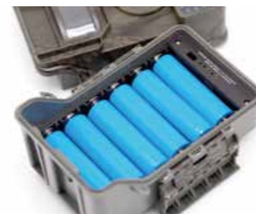
繰り返し充電・低温に強い リチウムイオン電池仕様

キャンズのトレイルカメラは到着後すぐに使える & 安心保証!! アフターフォローも充実!! 日本語マニュアル / SDカード 16GB (Class10) 1枚 / 単三アルカリ乾電池 4本 / リチウムイオン電池 6本 / 保証書 (1年・免責事項あり) 保証期間終了後や保証外の修理も 3,000円 (税別) 以内補償!! (但し、液晶・基盤・レンズの修理を除く)