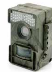
ロックバックルを採用 水の侵入をしっかり防止