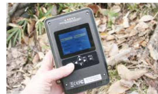
2.36 インチ TFT モニター 大きくなってより見やすく